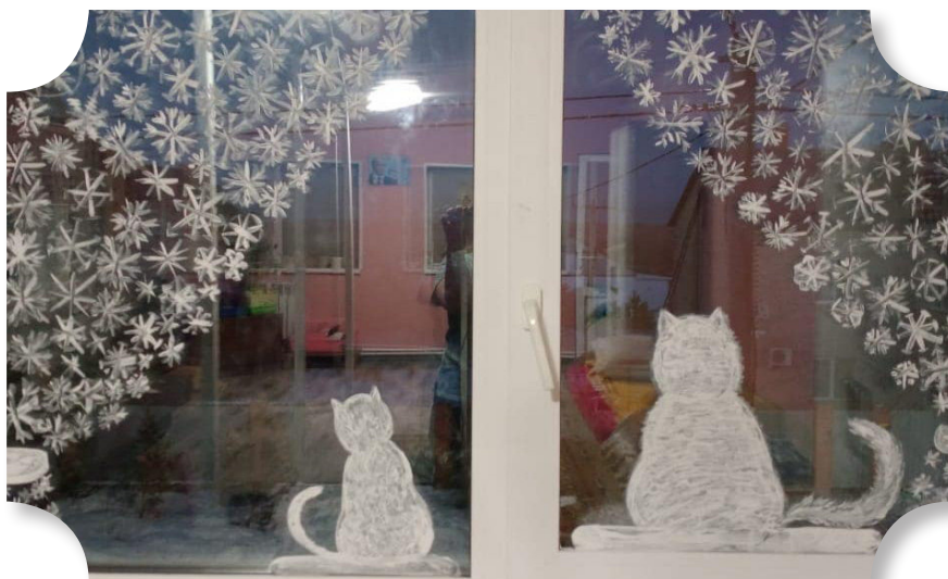
Разрисованное окно нашего дома.

Дорогие наши друзья, мы от всей души желаем, чтобы и в ваших семьях сбывались самые заветные мечты! Мы-то уж точно знаем: если по-настоящему мечтать, исполняется даже самое невероятное!