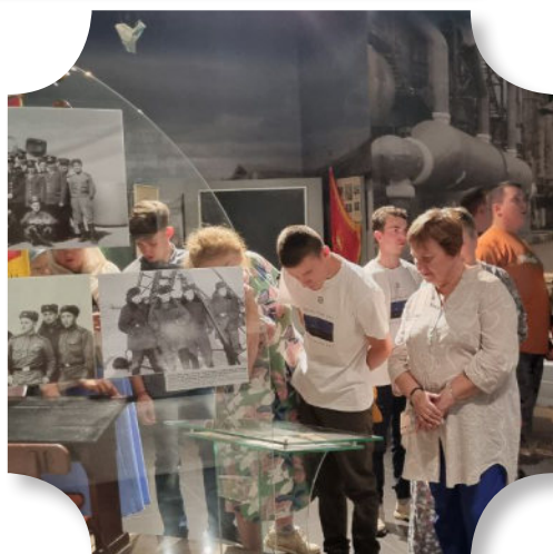
В музее В.С. Черномырдина.