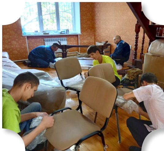
Ура, теперь у нас есть стулья!

Время теперь летит по-другому. Раньше в интернате время измерялось от пятницы до пятницы — в ожидании наших встреч. Сейчас каждый день — это калейдоскоп эмоций, открытий и маленьких побед. Порой хочется сделать «стоп-кадр» или «законсервировать» это ощущение: мы — дома!